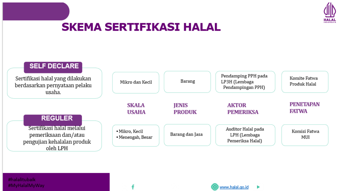
Gambar 1. Skema Sertifikasi Halal

Proses ini diakhiri dengan mengajukan permohonan sertifikasi halal dengan pernyataan pelaku usaha melalui SIHALAL. Proses lengkap untuk self-declare sertifikasi halal terdapat pada gambar berikut: