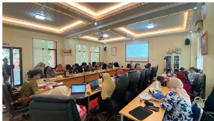
Gambar 4. Peserta Sosialisasi Ekosistem Halal Bagi UMKM

Selain materi yang diberikan oleh tim Pengabdian Masyarakat, program sosialisasi ini juga mendapatkan materi tentang pemasaran dan proses bisnis UMKM dari Universitas Pahlawan serta dari Dinas Koperasi dan UMKM dan DinaKabupaten Kampar. Daalam kegiatan ini, turut hadir juga perwakilan KADIN kabupaten Kampar