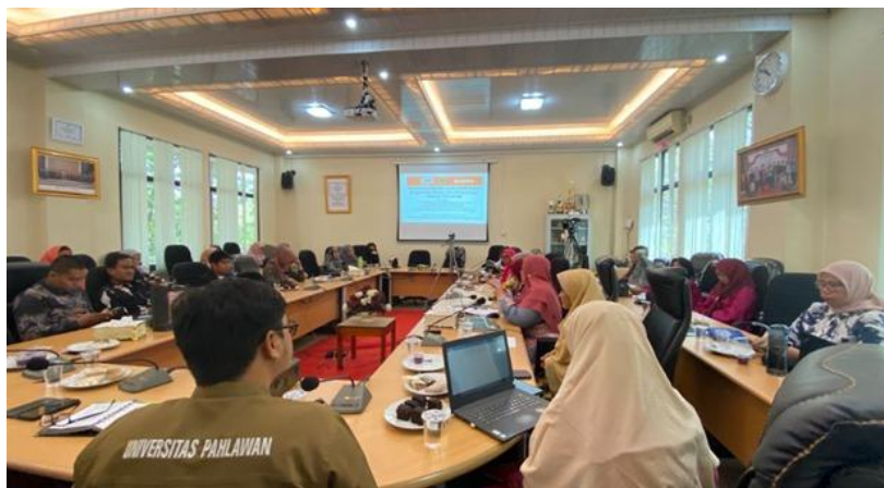
Gambar 6. Peserta Sosialisasi Ekosistem Halal Bagi UMKM