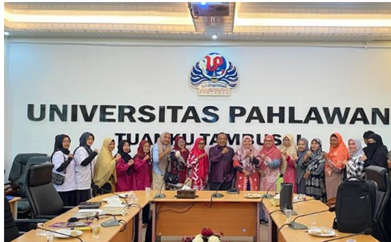
Gambar 5. Peserta Sosialisasi Ekosistem Halal Bagi UMKM