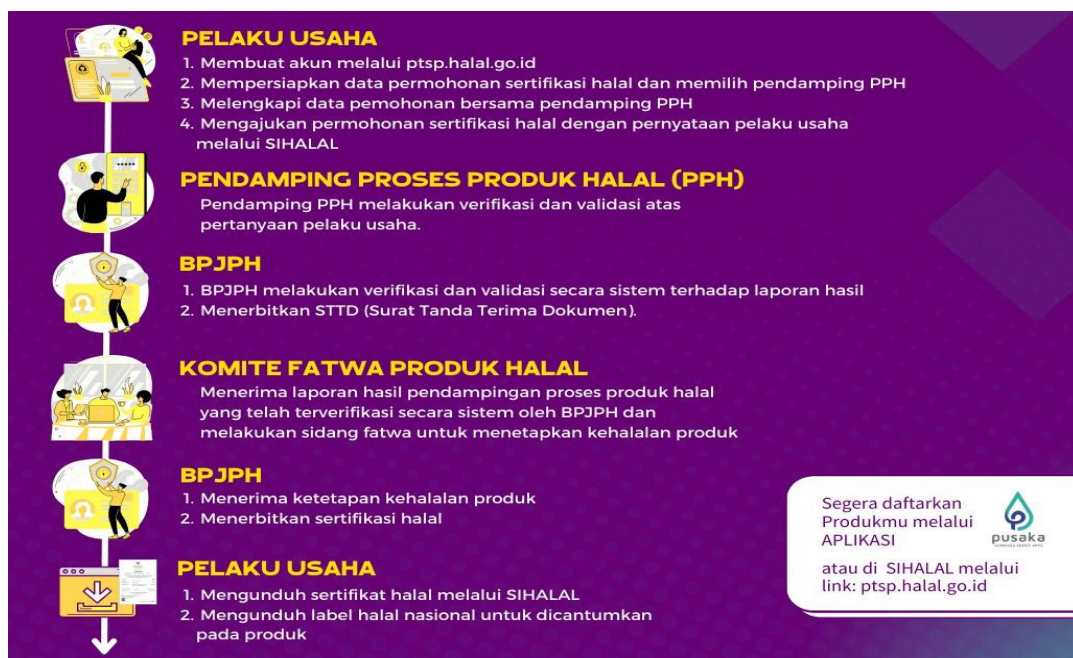
Gambar 1. Pendampingan Bisnis dan Ekosistem Halal

Proses ini diakhiri dengan mengajukan permohonan sertifikasi halal dengan pernyataan pelaku usaha melalui SIHALAL. Proses lengkap untuk self-declare sertifikasi halal terdapat pada gambar berikut: