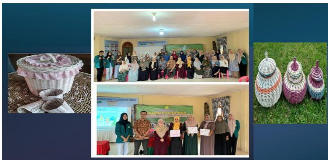
Gambar 4. Foto bersama Peserta kegiatan dan foto para pemenang doorprize