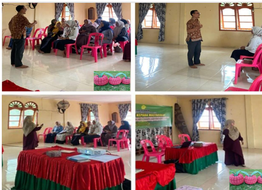
Gambar 3. Foto Pemateri