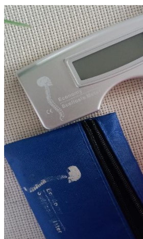
(b) Alat Skoliometer