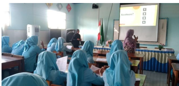
(a) Kegiatan Edukasi