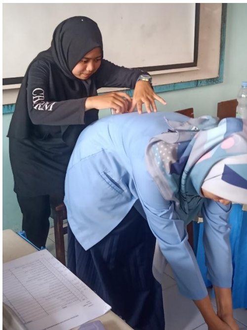
Gambar 1. Deteksi dini skoliosis dengan alat skoliometer