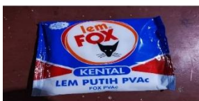
Gambar 7. lem guna untuk menguatkan sambungan bamboo