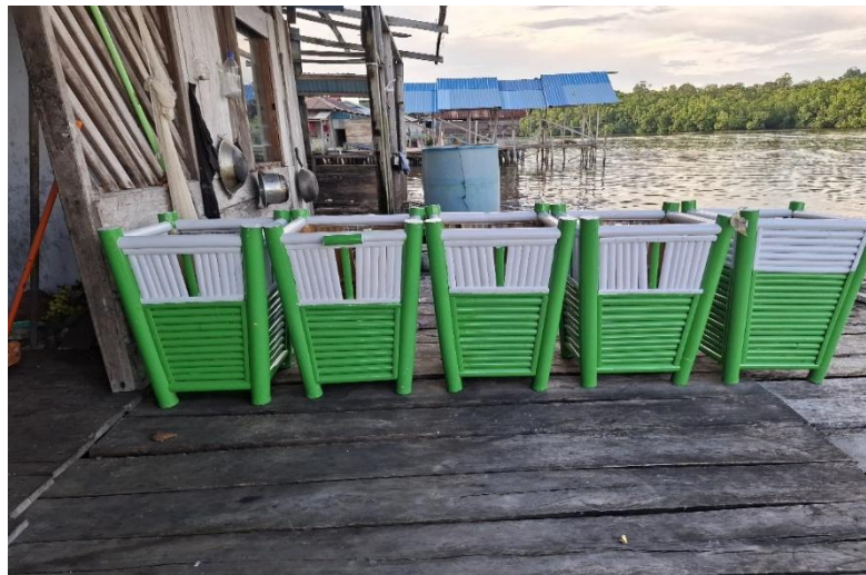
Gambar 16 proses penyelesaian

Setelah pengawetan selesai, bak sampah bambu diberi sentuhan akhir seperti pengecatan dengan cat anti air untuk menambah daya tahan terhadap cuaca eksternal.