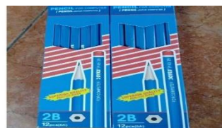
Gambar 8 pensil untuk menyesuaikan ukuran