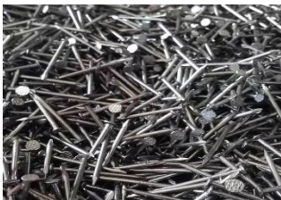
Gambar 5 guna untuk memaku bamboo