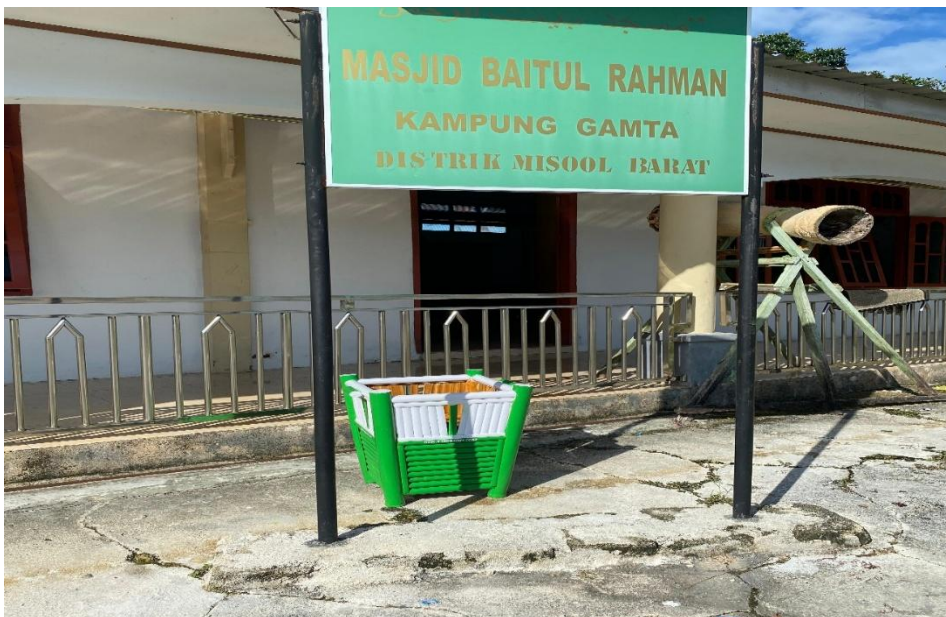
Gambar 19. Dokumentasi penempatan bak sampah di mesjid kampung gamta