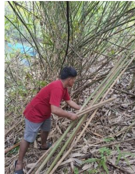
Gambar 2. hasil bambu yang terpilih