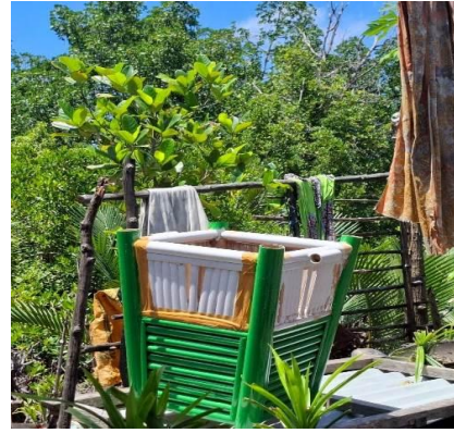
Gambar 15 proses penjemuran cat sampah