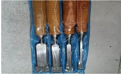
Gambar 9. pat untuk memotong dan menyesuaikan bambu