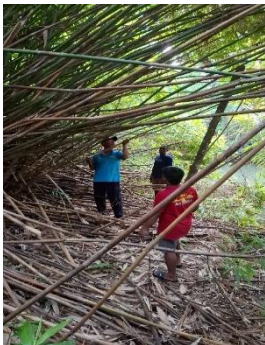
Gambar 1. observasi pemilihan terhadap bambu

Bambu yang digunakan adalah bambu petung yang memiliki diameter besar dan kekuatan yang cukup untuk menahan beban sampah. Bambu dipilih dengan mempertimbangkan kualitas dan keawetan.