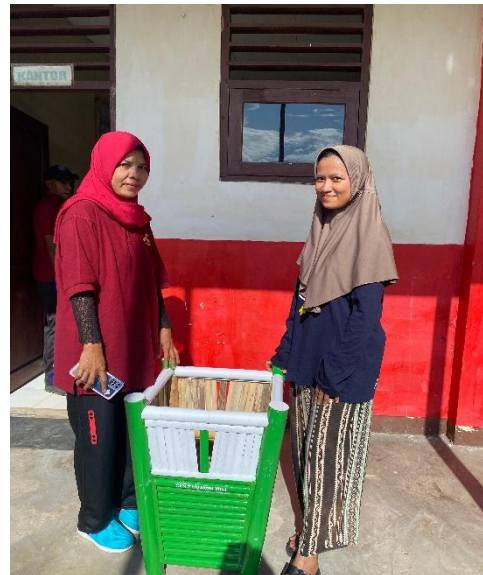
Gambar 17. Dokumentasi bersama dengan guru-guru SDN 18 gamta