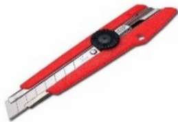
Gambar 3. cater guna menghaluskan bambu

1) Alat: Pisau/cater, gergaji, paku, bor, lem bambu, pensil, pat