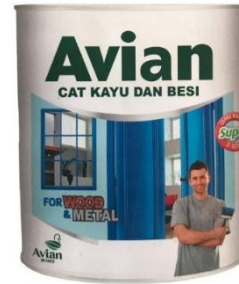
gambar 11 cat bambu