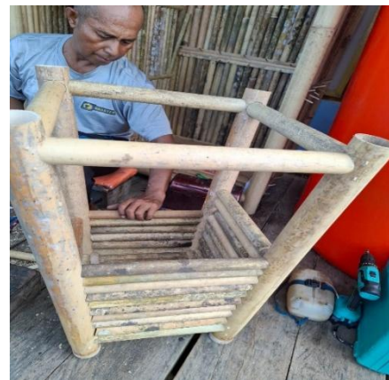
Gambar 13. penyusunan bambu