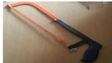
Gambar 4. guna untuk memotong bambu