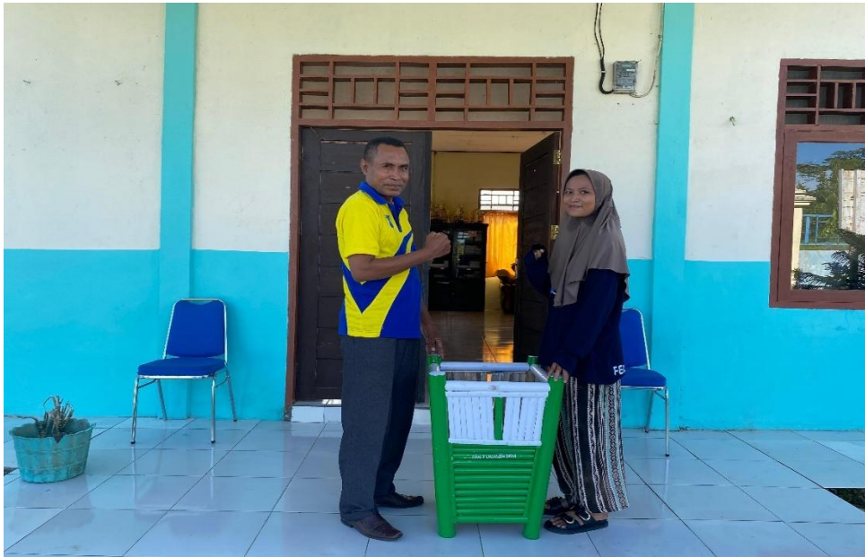
Gambar 18. Dokumentasi dengan kepala sekolah SMP Negeri 23 Magei