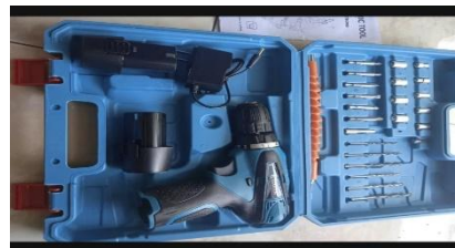
Gambar 6 bor guna untuk melubangkan bambu