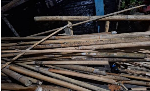
Gambar 10 observasi bambu