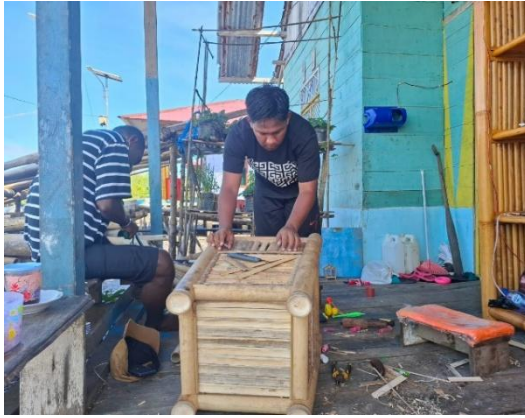
Gambar 14 proses penyelesaian pembuatan bak sampah