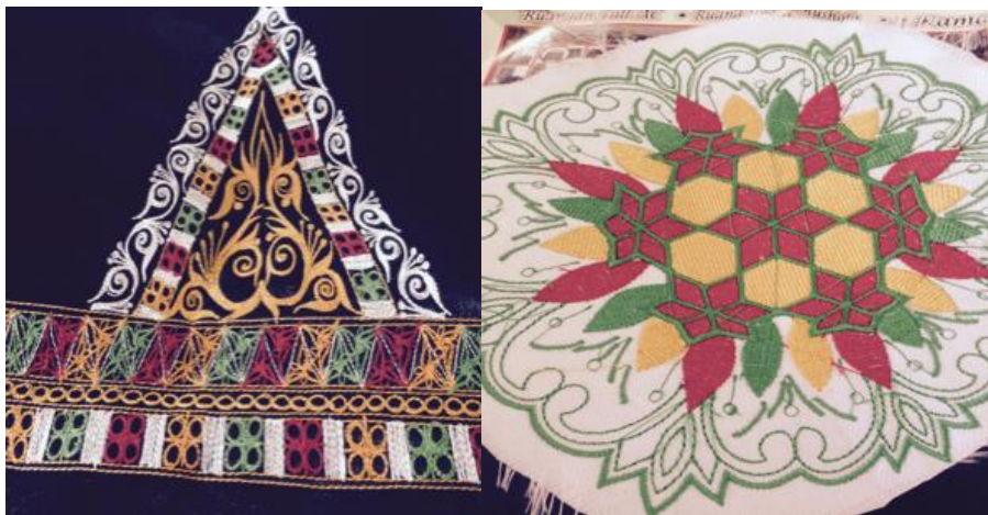
Gambar 10. Hasil Bordir Motif Aceh Terbaru

Untuk memenuhi beragam kebutuhan konsumen maka hal yang sangat penting dilakukan oleh pengrajin souvenir adalah perluasan desain produk. Melalui pendampingan yang intensif dengan pendekatan diskusi antar personal yang panjang dan melalui problem solving terhadap persoalan-persoalan desain produk terkait order barang kerajinan oleh pihak konsumen atau pihak eksportir, mitra industri mulai memperkaya desain bordir dan desain tas dan dompet terbaru untuk meningkatkan penjualan produk baik di dalam negeri maupun di luar negeri.