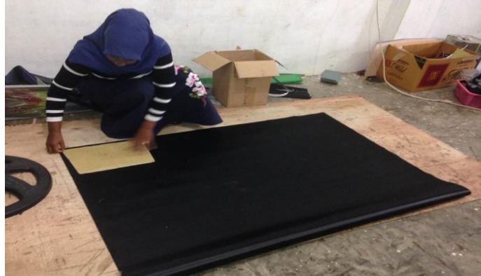
Gambar 5. Melakukan Pemotongan Kain dan Pola Pada Lantai (Foto Sebelum)

Setelah pekerja memakai kursi dan meja yang ergonomi yang telah disediakan dan dirancang oleh pelaksana pengabdian, para pekerja tidak lagi mengeluh kelelahan, pegal-pegal, dan kesakitan, kecepatan ketika bekerja, dan produktivitas kerja pun semakin meningkat. meja kerja yang ergonomis yang telah dibuat oleh tim pengabdian dapat dilihat pada gambar berikut ini: