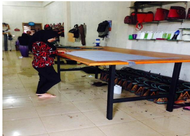
Gambar 6. Pemotongan Kain dan Pola Pada Meja Ergonomis (Foto Sesudah)