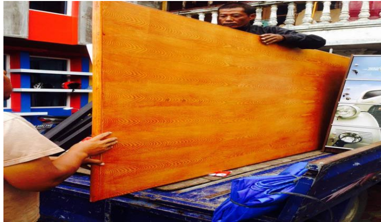
Gambar 9. Pengangkutan Barang Peralatan Kerja Ketempat Pengrajin UKM