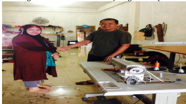
Gambar 7. Penyerahan Mesin Jahit, lemari, Kursi, dan Meja Ergonomis