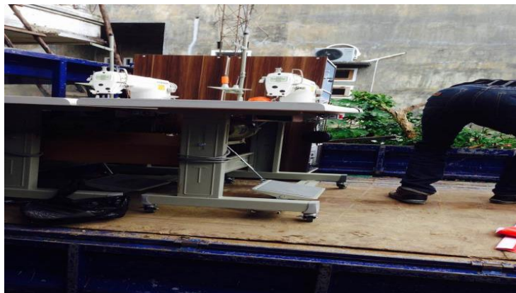
Gambar 8. Pengangkutan Barang Peralatan Kerja Ketempat Pengrajin UKM

Kegiatan penataan ruang kerja yang ergonomi ini dapat mengurangi beban kerja pekerja tersebut, terhindar nya gangguan kesehatan kerja adalah mencakup posisi kerja, cara kerja, tata letak, dan beban kerja, dimana keselamatan kerja adalah sebagai rangkaian usaha untuk menciptakan suasana kerja yang aman dan tentram bagi para pekerja yang bersangkutan. Kegiatan pengadaan peralatan ergonomis dapat dilihat pada Gambar berikut: