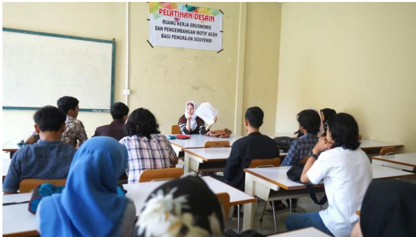
Gambar 11. Pelatihan Ruang Kerja Ergonomis dan Pengembangan Motif Aceh