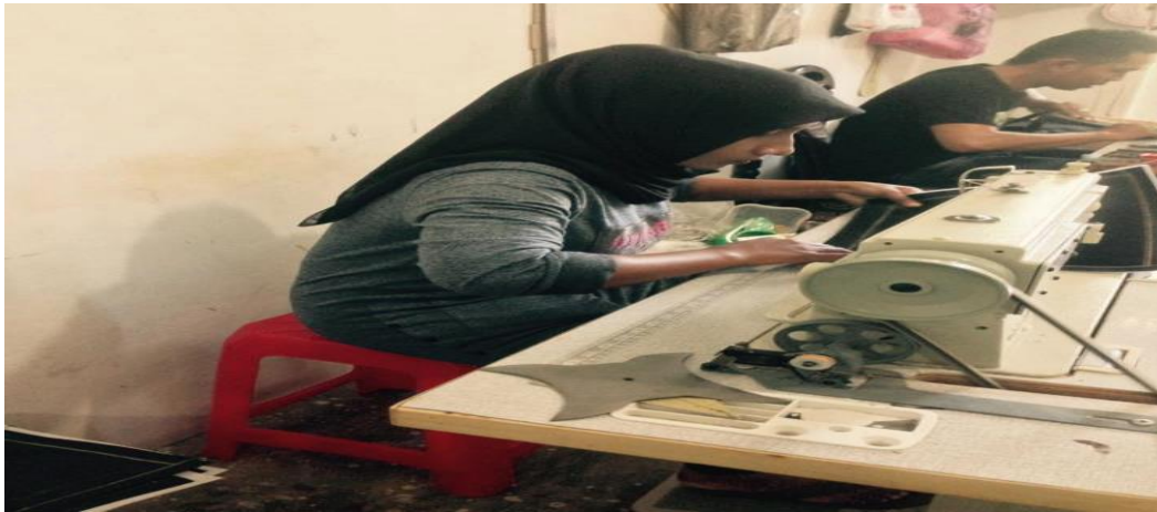
Gambar 2. Foto Kursi Kerja Plastik yang tidak Ergonomi (Foto Sebelum)

Berdasarkan hasil survey dan wawancara dengan UKM, tenaga pekerja di UKM memakai kursi plastik yang keras dan tidak nyaman untuk menjahit sehingga pekerja sering mengeluh sakit leher, sakit punggung, sakit pinggang, kelelahan dan pegal-pegal sehingga hasil kerja tidak maksimal, oleh karena itu agar sikap duduk pekerja nyaman dan tidak mengalami kelehan maka di lakukan penyediaan kursi yang nyaman untuk tenaga kerja.