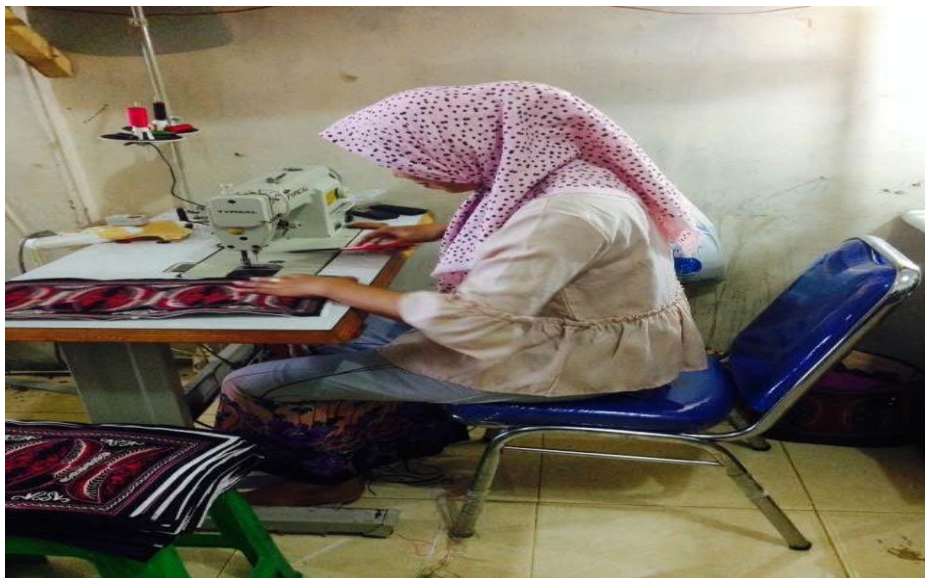
Gambar 3. Foto Kursi Kerja Ergonomis (Foto Sesudah)

Setelah dilakukan pemakaian kursi yang ergonomis oleh pekerja, para pekerja tidak lagi mengeluh sakit leher, sakit punggung, sakit pinggang, kelelahan dan pegal-pegal, dan