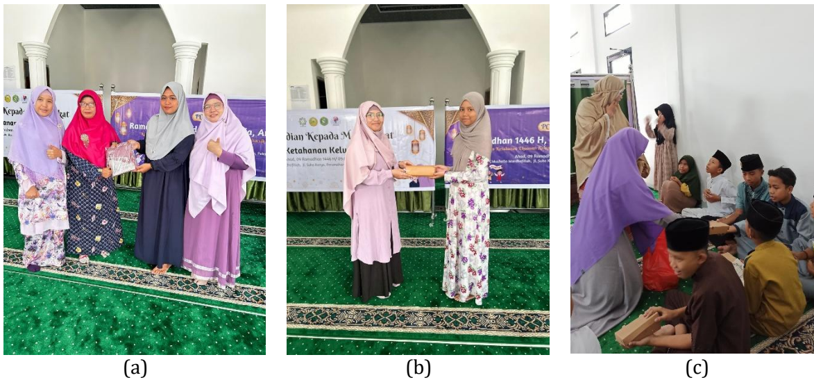
Gambar 5. Kegiatan pembagian Hadiah dan Souvernir

Selanjutnya kegiatan ditutup dengan foto bersama yang diikuti oleh seluruh panitia dan peserta. (Gambar 6).