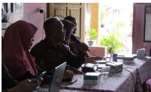
Gambar 1. Penyampaian Materi Oleh tim pengabdian

Pelaksanaan kegiatan pengabdian ini dibagi menjadi empat tahapan kegiatan yaitu pembukaan dan sambutan, pemaparan materi, tanya jawab, dan praktik pemanfaatan modul oleh guru. Sesi pembukaan diisi dengan sambutan oleh ketua Gugus III Kec. Gunungsari. Beliau menyambut baik dengan adanya kegiatan pengabdian kepada masyarakat yang dilaksanakan. Selain itu, beliau berharap kerjasama anatara sekolah anggota gugus III Kec, Gunungsari dan PGSD UNRAM dipertahankan dan diperluas jenisnya. Diawal kegiatan, peserta diberikan angket dalam bentuk google form sebagai bentuk pretes. Isian angket berkaitan dengan materi yang akan disampaikan yaitu konsep pengenalan diri, tahap pengenalan, akomodasi, tindakan, serta pengalaman peserta dalam mendampingi siswa SD dalam kegiatan pengenalan diri. Angket diisi melalui gawai masing-masing peserta.