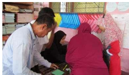
Gambar 4. Peserta Melakukan simulasi pemanfaatan modul

Tahap keempat yaitu simulasi pemanfaatan modul oleh peserta didampingi oleh pemateri. Namun tidak dihadirkan siswa SD, hanya dilakukan melalui peer discussion. Peserta dibagi menjadi 5 kelompok sehingga kegiatan praktik dapat berjalan dengan optimal. Adapun 9 pendampingan dilakukan dengan model satu pemateri satu kelompok. Kegiatan berjalan lancar karena peserta mengikuti setiap tahapan simulasi dengan antusias dan keinginan belajar yang besar.