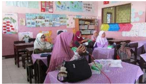
Gambar 3. Kegiatan Tanya Jawab terkait Materi

Setelah semua materi disampaikan, dilakukan sesi tanya jawab. Peserta cukup antusias karena topik pengabdian merupakan hal menarik dan jarang diperoleh. Setidaknya terdapat 5 orang penanya dengan focus pertanyaan pada setiap tahapan pengenalan diri siswa, peran apa yang bias guru posisikan, serta bagaimana upaya guru membantu siswa menggunakan modul yang diperkenalkan. Sesi tanya jawab dilaksanakan selama 30 menit.