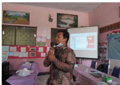
Gambar 2. Penyampaian Materi

Materi ketiga tentang konsep akomodasi. Pada tahap ini, materi utama mengaitkan tentang proses siswa memperoleh pemaknaan dan internalisasi atas aspek dan tugas perkembangan yang harus dikuasai. Adapun yang dipelajari pada tahap akomodasi yaitu tahapan siswa menerima keadaan diri sebagai bagian dari lingkungan (Subekti, 2018).