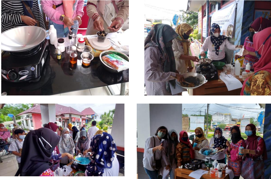
Gambar 3. Praktik pembuatan sabun dari limbah minyak jelantah