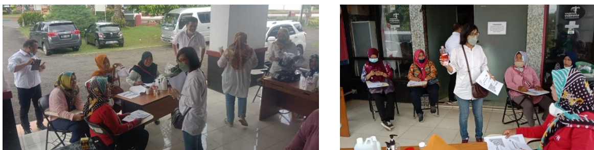
Gambar 2. Sosialisasi bahaya penggunaan minyak jelantah

Proses kegiatan ini diawali dengan penyampaian materi. Materi yang disampaikan pada kegiatan ini antara lain mengenai bahaya penggunaan minyak jelantah. Bahaya penggunaan minyak jelantah secara berulang dapat mengakibatkan timbulnya penyakit jantung, kanker serta meningkatkan kolesterol (Handayani et al., 2021). Selain itu apabila minyak jelantah dibuang melalui saluran air akan menyebabkan pencemaran lingkungan disekitar sehingga untuk memanfaatkan sisa minyak jelantah diberikan alternatif untuk mengolahnya menjadi sesuatu yang lebih bermanfaat (Ginting et al., 2020) (Afrozi et al., 2017), salah satu nya adalah dengan membuat sabun cair.