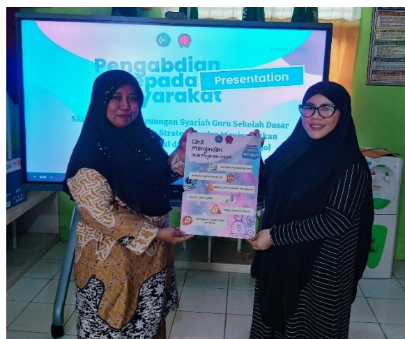
Gambar 1, 2, 3, 4: (1) Audiensi untuk kerjasama; (2) Koordinasi untuk pelaksanaan edukasi; (3) Pelaksanaan; (4) penyerahan poster sebagai kampanye menghindari jerat pinjol ilegal.

Hasil kegiatan pengabdian ini menunjukkan bahwa pendekatan edukatif-partisipatif mampu meningkatkan pemahaman peserta secara signifikan, khususnya pada aspek literasi keuangan Syariah yang sebelumnya menjadi titik terlemah. Temuan ini sejalan dengan penelitian yang dilakukan oleh Lusardi dan Mitchell (2014), yang menegaskan bahwa literasi keuangan memiliki peran penting dalam membentuk kemampuan individu dalam mengambil keputusan finansial yang lebih rasional dan terencana. Dalam konteks kegiatan ini, peningkatan pemahaman peserta terlihat tidak hanya pada aspek pengetahuan dasar, tetapi juga pada kesadaran terhadap risiko pinjaman online.