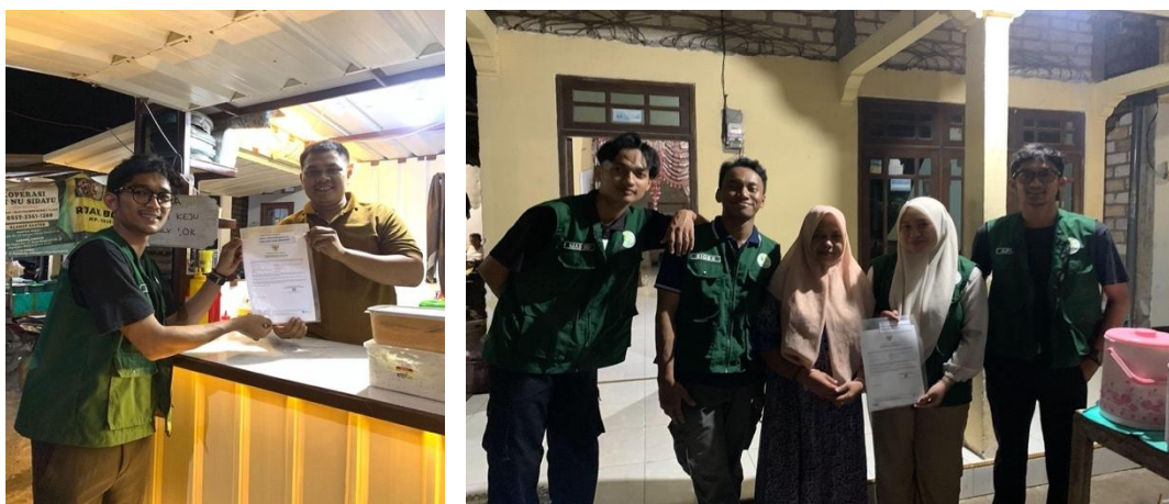
Gambar 3. Pembuatan NIB UMKM Desa Gedangan, Gresik

Pada kegiatan berikutnya, tim pengabdian masyarakat memberikan pendampingan melalui proses bimbingan teknis terkait tahapan pendaftaran usaha melalui sistem perizinan berbasis elektronik yang dikelola oleh Kementerian Investasi dan Hilirisasi/BKPM melalui Online Single Submission (OSS). Prosedur pembuatan NIB yang meliputi pendaftaran akun pada sistem OSS, pengisian data identitas pelaku usaha, pengisian data usaha, pemilihan klasifikasi usaha, hingga proses penerbitan dokumen NIB.