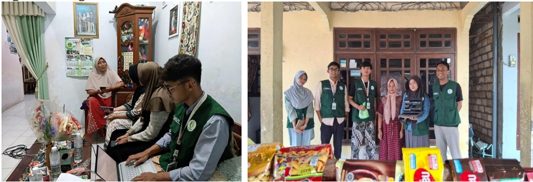
Gambar 1. Survei dan Identifikasi Pelaku UMKM

kegiatan pendampingan dan pelatihan terkait pembuatan penanda lokasi usaha pada Google Maps serta pengurusan legalitas usaha.