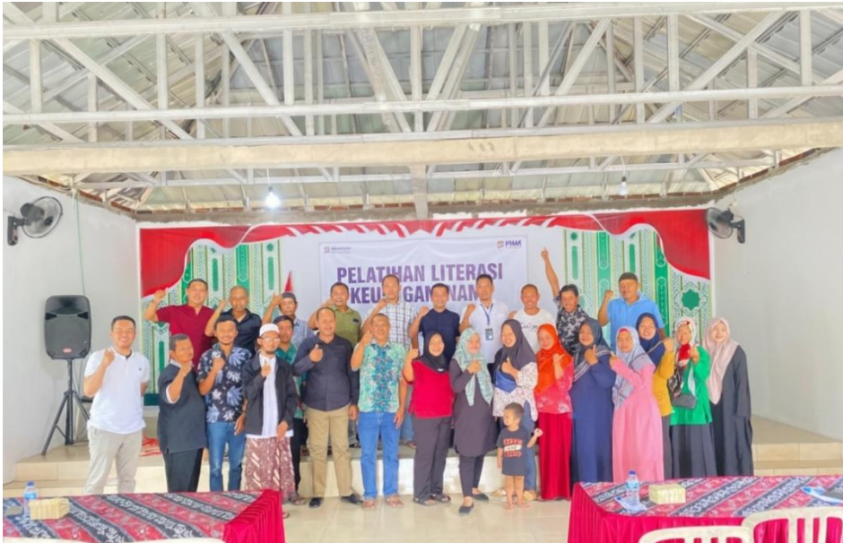
Gambar 2. Workshop dan Bimtek Literasi Keuangan di Era Digital

untuk menjaga kontinuitas literasi keuangan syariah dengan menyediakan layanan mentoring bagi masyarakat yang tertarik untuk mendalami lebih jauh aspek keuangan syariah.