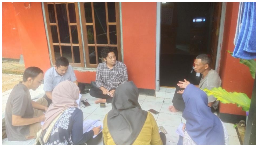
Gambar 3 Monitoring dan Pendampingan Kepada Peserta Workshop

Kuesioner digunakan untuk mengukur tingkat pemahaman literasi keuangan syariah sebelum dan sesudah pelatihan, sedangkan wawancara bertujuan menggali persepsi masyarakat terhadap penggunaan teknologi keuangan syariah. Data dianalisis secara deskriptif kuantitatif menggunakan persentase untuk melihat perubahan tingkat literasi keuangan syariah masyarakat.