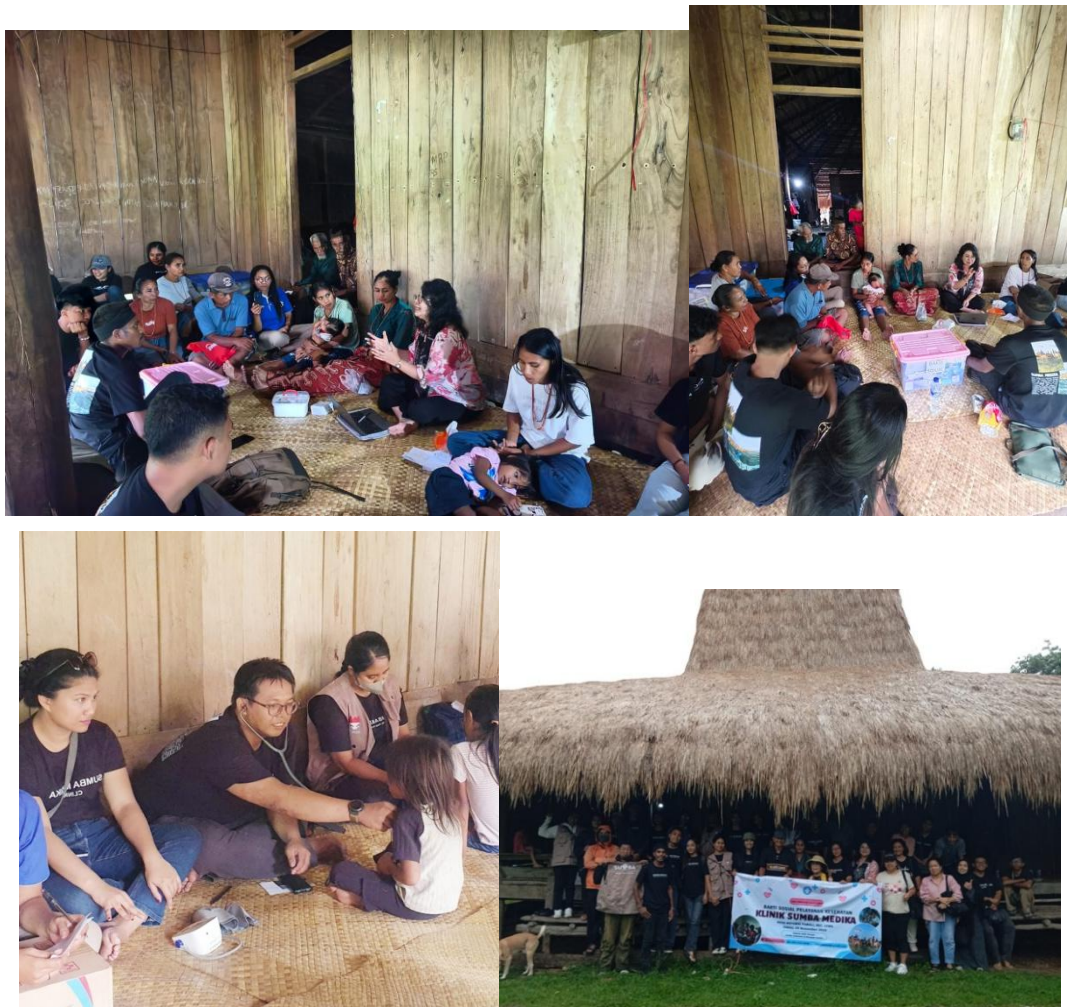
Gambar 3. Rangkaian Gambar Pelaksanaan Kegiatan Pengobatan Gratis dilengkapi Literasi Kesehatan & Literasi Keuangan Koperasi & UMKM

Selanjutnya pada sesi ke-2 yang dilakukan setelah terlebih dahulu tim menyelesaikan makan siang bersama penduduk. Pada hari itu, para peserta disugahi makanan khas penduduk berupa sayur singkong tumbuk dan daging ayam berbumbu yang dibakar. Selain itu, diajarkan pula cara mengunyah sirih, pinang dan kapur yang menjadi tradisi penduduk dalam menyambut tamu. Acara Pembekalan dimulai dengan melakukan pre-test terlebih dahulu dan dilanjutkan dengan membagikan pengetahuan tentang pengelolaan dan manajemen Koperasi dan UMKM, sharing dan diskusi serta berbagai pertanyaan terkait topik tersebut. Selanjutnya disampaikan pula manfaat pemasaran produk melalui media sosial, pencatatan akuntansi sederhana dan pemahaman akan pemupukan modal dilakukan pada sesi ini. Untuk setiap topik, peserta diminta menyampaikan pertanyaan terkait masalah yang dihadapi di lapangan. Berikut berbagai foto yang menggambarkan situasi pada acara tersebut.