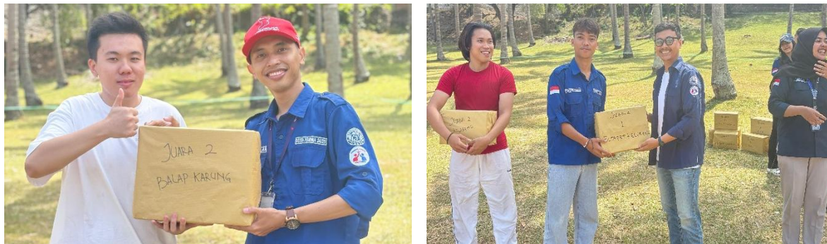
Gambar 4. Pembagian Hadiah

Kegiatan terakhir dari acara pengabdian kepada masyarakat ini adalah kegiatan lomba. Seluruh peserta dibagi kedalam beberapa tim untuk berkompetisi pada berbagai lomba yang sudah dipersiapkan. Lomba yang dipersiapkan Adalah lomba yang mampu melatih kemampuan Kerjasama tim, koordinasi, komunikasi, serta penyusunan strategi. Hal ini dilakukan dengan tujuan untuk membentuk mental yang unggul dari seluruh peserta kegiatan pengabdian ini.