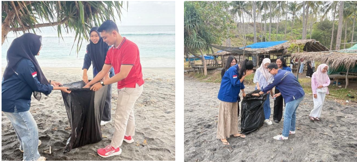
Gambar 2. Kegiatan Peduli Lingkungan

membuka bisnis, para pemilik UMKM yang mayoritas menjual sate bulayak sudah melakukan riset pasar untuk bahan baku seperti daging ayam, rempah-rempah, dan bahan baku untuk lontong. Setelah pembukaan bisnispun, mayoritas pemilik UMKM sudah menerapkan manajemen pemasaran pada bisnisnya seperti adanya diskon jika membeli sate bulayak dalam jumlah yang banyak. Pemateri menekankan bahwa ilmu manajemen sangat bermanfaat dan di butuhkan untuk bisnis yang berkelanjutan. UMKM di Pantai Klui Adalah saksi bagaimana ilmu manajemen diterapkan dan menghasilkan bisnis yang berkelanjutan, terbukti dari usaha sate bulayak yang sudah diwariskan turun temurun.