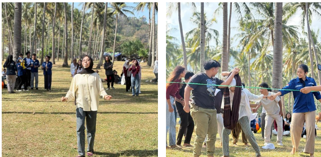
Gambar 3. Kegiatan Lomba

Setelah kegiatan edukasi manajemen bisnis selesai, kegiatan dilanjutkan dengan kegiatan peduli lingkungan. Tim pengabdian dan peserta berkomitmen untuk berkontribusi aktif pada kebersihan lingkungan di Pantai Klui secara umum dan di wilayah UMKM Sate Bulayak secara khusus. Tim dan peserta bahu membahu membersihkan pantai dan Lokasi UMKM dari sampah. Hal ini ditujukan untuk mencegah kerusakan flora dan fauna Pantai Klui yang bisa saja disebabkan oleh sampah sekaligus menciptakan lingkungan yang bersih untuk meningkatkan kualitas pelayanan UMKM Sate Bulayak kepada pengunjung yang datang.