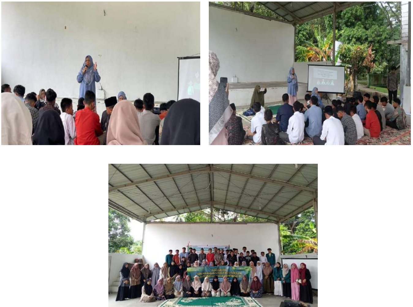
Gambar 2. Kegiatan PKM (dokumentasi pribadi)

Berdasarkan hasil kegiatan yang telah dilakukan, dapat ditarik sejumlah pemahaman yang lebih mendalam mengenai efektivitas pendekatan pendidikan karakter berbasis Islam dalam mencegah dan menangani bullying . Pertama, pendekatan keagamaan terbukti mampu menyentuh sisi afektif siswa yang seringkali tidak tersentuh oleh pendekatan akademis biasa. Ketika siswa diberi pemahaman bahwa setiap manusia adalah ciptaan Allah SWT yang mulia, bahwa menyakiti orang lain adalah bentuk kezaliman yang dibenci oleh Allah, dan bahwa Islam menjunjung tinggi akhlak mulia, maka mereka lebih mudah memahami alasan mengapa bullying harus dihentikan. Ini menunjukkan bahwa pendidikan karakter yang dikaitkan langsung dengan ajaran agama lebih mudah diterima oleh siswa, terutama yang berada di lingkungan sekolah berbasis Islam.