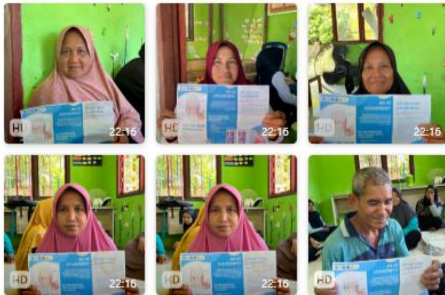
Gambar 3. Antusiasme Masyarakat mengikuti Penyuluhan

demonstrasi latihan fisik sederhana yang aman bagi penderita osteoarthritis, nilai rata-rata post-test meningkat menjadi 70. Dengan demikian, terdapat peningkatan skor sebesar 40%.