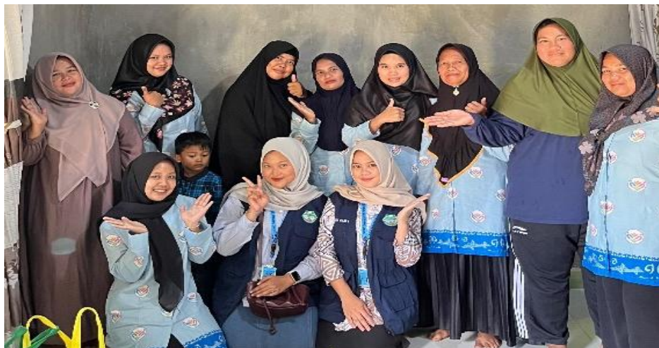
Gambar 2. Dokumentasi Penyuluhan di Posyandu

Kurangnya akses masyarakat terhadap pelayanan kesehatan, menyebabkan kurangnya kontrol terhadap keadaan penyakitnya khususnya pada lansia. Dengan adanya edukasi kesehatan diharapkan adanya peningkatan pengetahuan yang didapatkan dapat membantu para lansia dalam upaya menangani penyakit osteoarthritis (Astri Wahyuni et al., 2024)