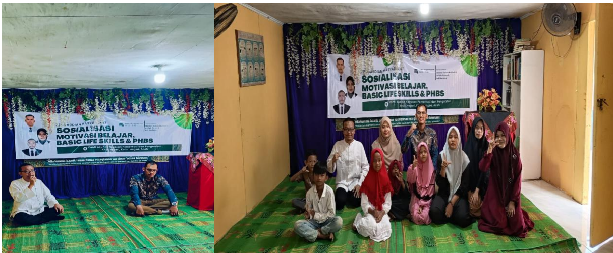
Gambar 1. Kegiatan Sosialisasi PHBS di Panti Asuhan Yayasan Pemerhati dan Penguatan Anak Negeri Kota Langsa, Aceh

menambah daya tarik, materi disusun dengan menggunakan bahasa yang mudah dimengerti dan didukung dengan gambar ilustrasi. Dengan cara ini, anak-anak dapat lebih mudah memahami pesan yang disampaikan.